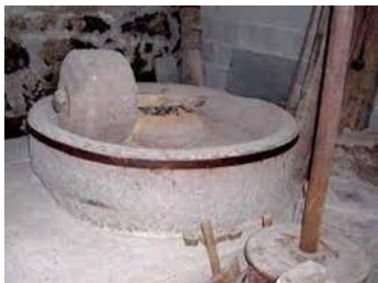
Vie et mort du moulin de Celoux